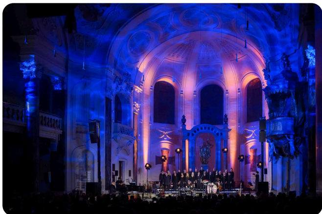
Der Solitude-Chor, Konzert 2024