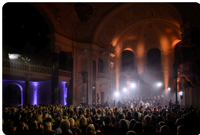
Standing Ovation, Konzert 2024