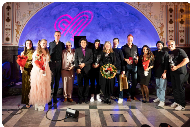
WUAHL pianissimo 2025, Marmorsaal Stuttgart