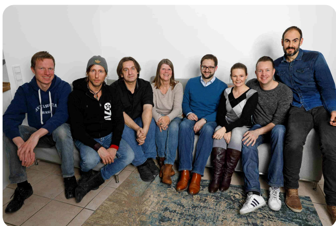
Die Mitglieder des Vereins